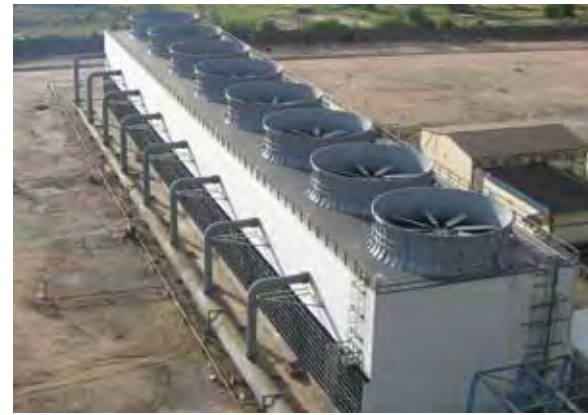
Torre de enfriamiento de contra flujo "Planta Termoeléctrica - Francisco Pérez Ramos - Unidad 3" ubicada en Tula Hidalgo, México con capacidad de 100,000 GPM fabricada en FRP.