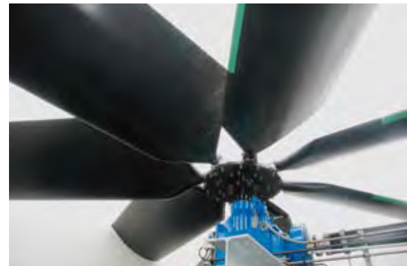
El correcto dimensionamiento de los ventiladores son fundamentales y garantizan el rendimiento a largo plazo de la torre