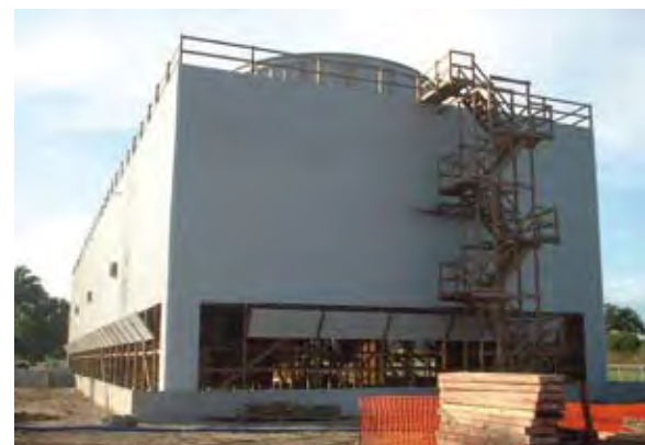
Torre de enfriamiento de contra flujo "Planta de Nitrógeno - Samaria" ubicada en Villahermosa Tabasco, México con capacidad de 60,000 GPM fabricada en madera.